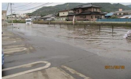
地盤沈下で冠水(女川町浦宿駅前)

被災地は必死で動いている。しかし動きたくても地盤沈下や放射線などによってどうすることもできない地域も数多くある。今までは生活を取り戻そうと協力してきた。しかし、住環境が仮設住宅などであるとはいえ、一息はついてきた今だからこそ、衝突が増え始める時でもある。東北で起こっている災難を他人事と思わず、冷静な協力と対応が不可欠であり、その最たるが、瓦礫の焼却や汚染土の処理である。国は平常時年間 1mSv 以下の被曝基準を設けた。この数字は 100mSv 以上被曝したときに健康に害を与える研究結果があり、100 歳まで生きた仮定で算出している。ところが、日本人は通常、自然環境下および医療による被曝量は 4.0mSv/年に上る。この数値は今見つかっている最大の汚染米を日本人の年間平均 60kg 食べた値とほぼ同等である。さらに病気の発症率から概算した値で単純な比較にはならないが、喫煙は年間 1000～2000mSv に相当する。この数字を皆さんはどう見るであろう。喫煙者の生存率を考えれば、放射線のリスクはかなり少ないともいえる。何度も言うが、簡単には比較できない。内部被曝は継続的であり、避けられるのであれば避けたい。しかし、既婚女性対象のある調査では、放射線が未検出の東北産のコメを買い控える割合が関東で 3 割、関西では 4 割に上る。放射線は目に見えず、危険であることに変わりはないが、感覚的な行動は被災地を苦しめるだけでなく、日本そのものを苦しめることにつながる。他にも 8000Bq/kg 以下の汚染土や瓦礫は埋め立て処分可能である。全国各地の市町村が測定を重ね、安全に細心の注意を払いながら受け入れようとしているが、住