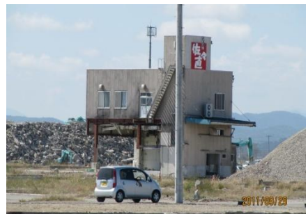
閑上地区に残る数少ない建物

これは特別な行動ではなく正常性バイアスと呼ばれるものだ。その後海岸線沿いの住民から我に返ったように逃げ始める。ところが車は5差路の信号機が止まり、閑上大橋は通行止めで大渋滞。さらに避難所の校庭や駐車場にも大挙人が押し寄せた。脇道を通れば仙台東部道路より内陸に逃げられたはずだが、人々はそうしなかった。みんながいるところにいれば大丈夫。これが同調バイアスである。すでに冷静さを失い、呼びかけにも集団は応じなかったようだ。また、他人を助け