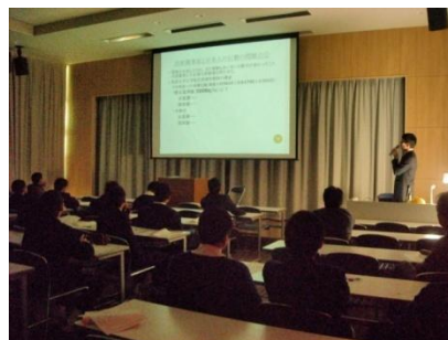
12.21 土曜サロンにて講演

最後に、気仙沼港のカツオの水揚げ量は今年も日本一である。被災地のいち早い復興を心から祈る。