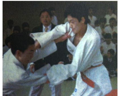
白陵中2年時の柔道大会にて

新年あけましておめでとうございます。2015年が始まりました。受験生はセンター試験も終わり、いよいよ二次試験に向けてラストスパートをかける時期ですね。私事ではありますが、初詣に行った際に「今年は健康で過ごせますように」とお祈りしたところ、2日後にインフルエンザにかかり、新年早々神様に裏切られ雲行きが怪しい1年になりそうです。